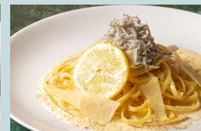
しらすとパルミジャーノの レモンカルボナーラ