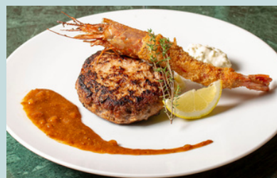
blue terminal ハンバーグステーキ & 有頭海老フライ -味噌マスタードデミグラス