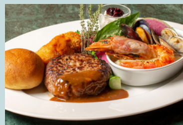
blue terminal コンボプレート -ハンバーグ&シーフードドリア 蟹クリームコロッケ、ミニデザート