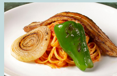
自家製ベーコンの 横濱ナポリタン