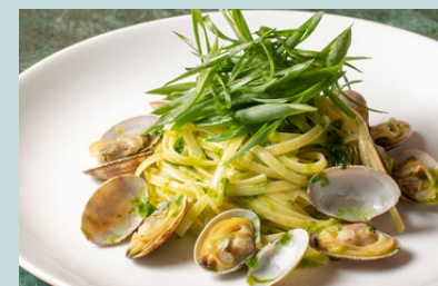
九条葱と青海苔の ボンゴレヴェルデ