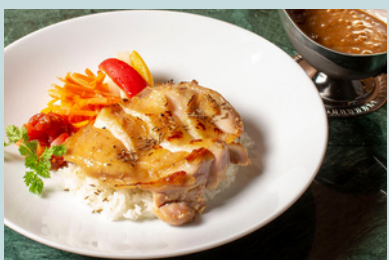
カレーライス w/ 醤油麹柚子チキンのグリル