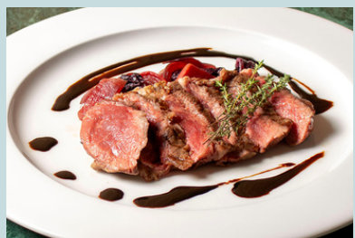
Beef tagliata steak w/ agrodolce 2400