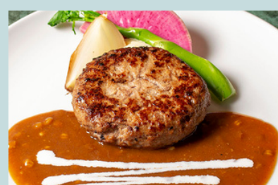
Hamburg steak w/miso mustard demi glace 1800