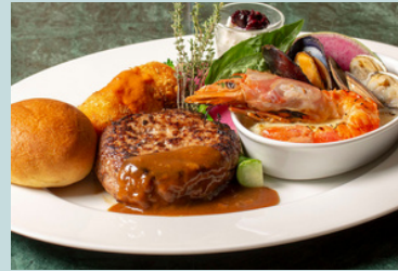
blue terminal combo plate -Hamburg, seafood dria ,bread crab cream croquette, dessert 2700