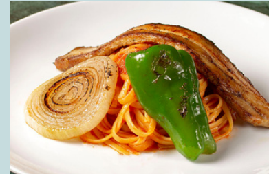
Yokohama napolitan 1600