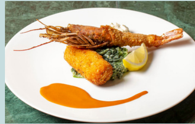
Deep fried prawn & crab cream curoquette w/dashi aurora source 1800