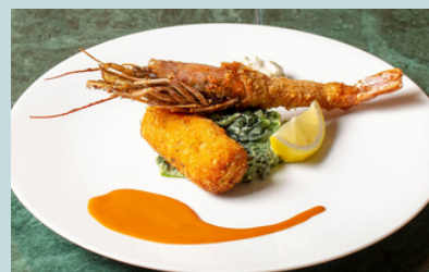
有頭海老フライ & 蟹クリームコロッケ -出汁オーロラソース&山葵タルタル