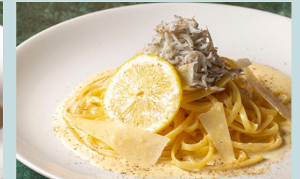
Whitebait & lemon carbonar 1600