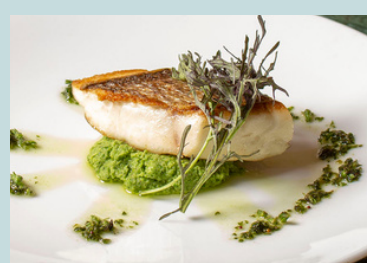
Sea bream grill w/broccoli pure, shiso 1800