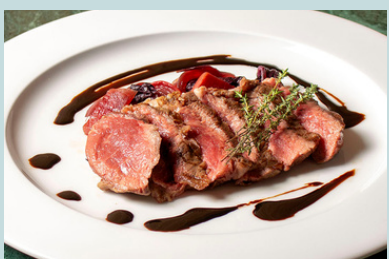
大麦牛のタリアータステーキ w/アグロドルチェ