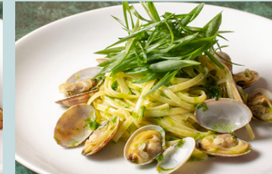
Kujo-negi & nori vongole verde 1500