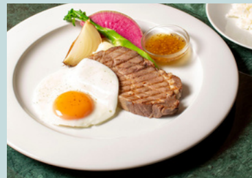
Roast pork & egg plate w/honey mustard 1700