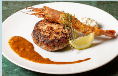
Hamburg steak & deep fried prawn w/miso mustard demi glace 2000