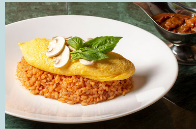
Fresh mushroom hashed beef omelette rice 1700