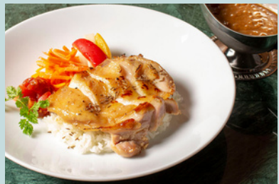
Grill chicken curry 1500